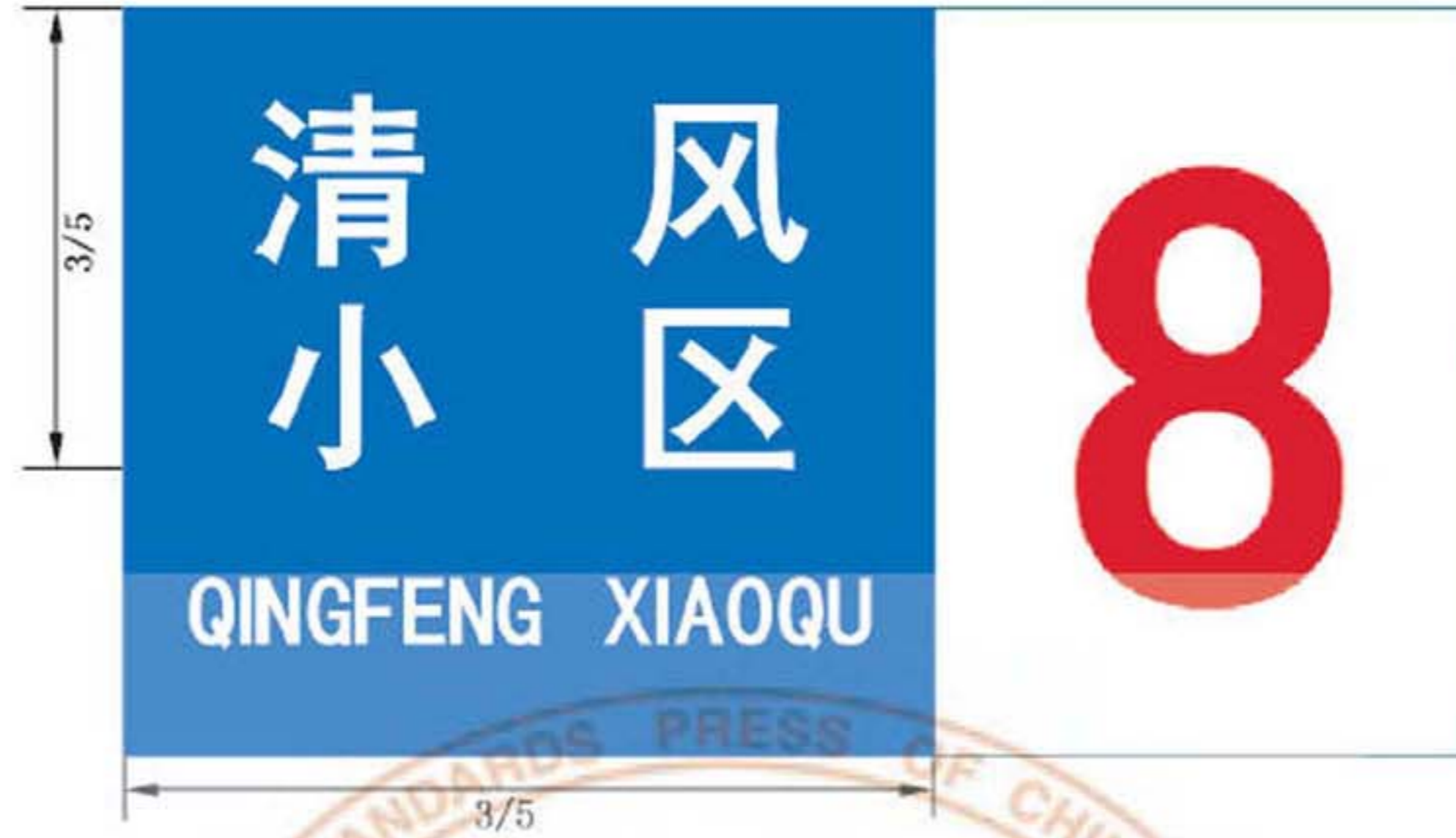
图 B. 16 楼地名标志版面示例