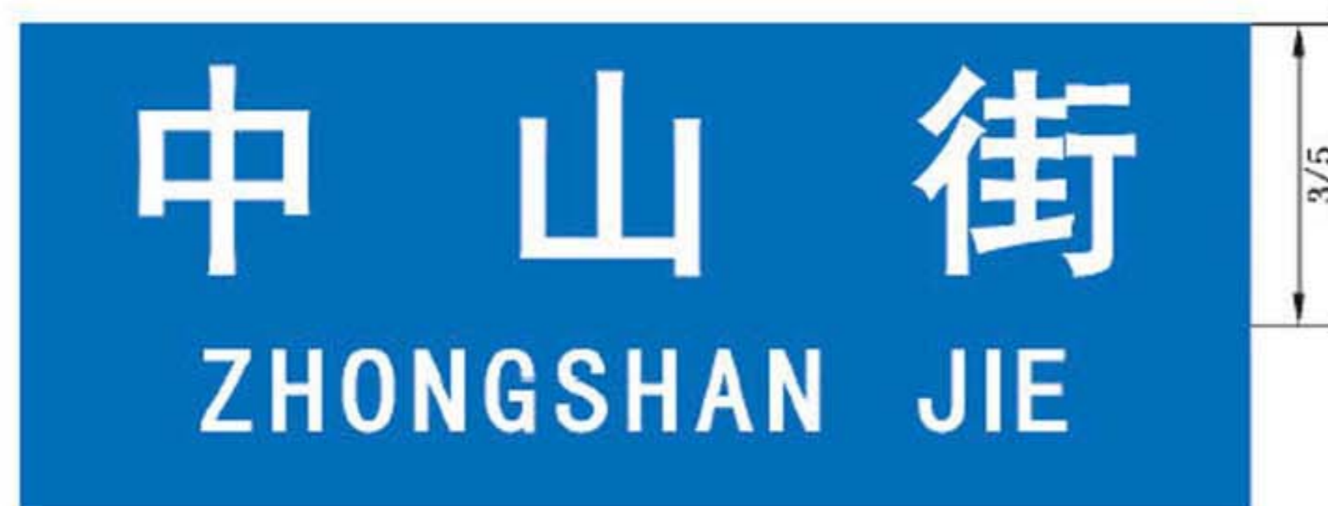
图 B.11 街地名标志版面示例