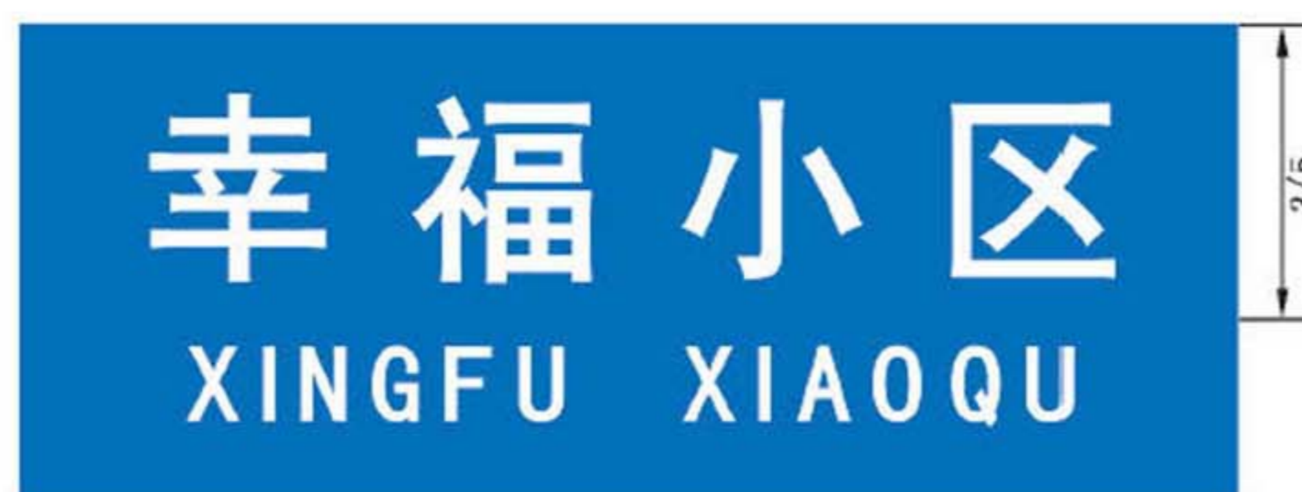
图 B.14 小区地名标志版面示例