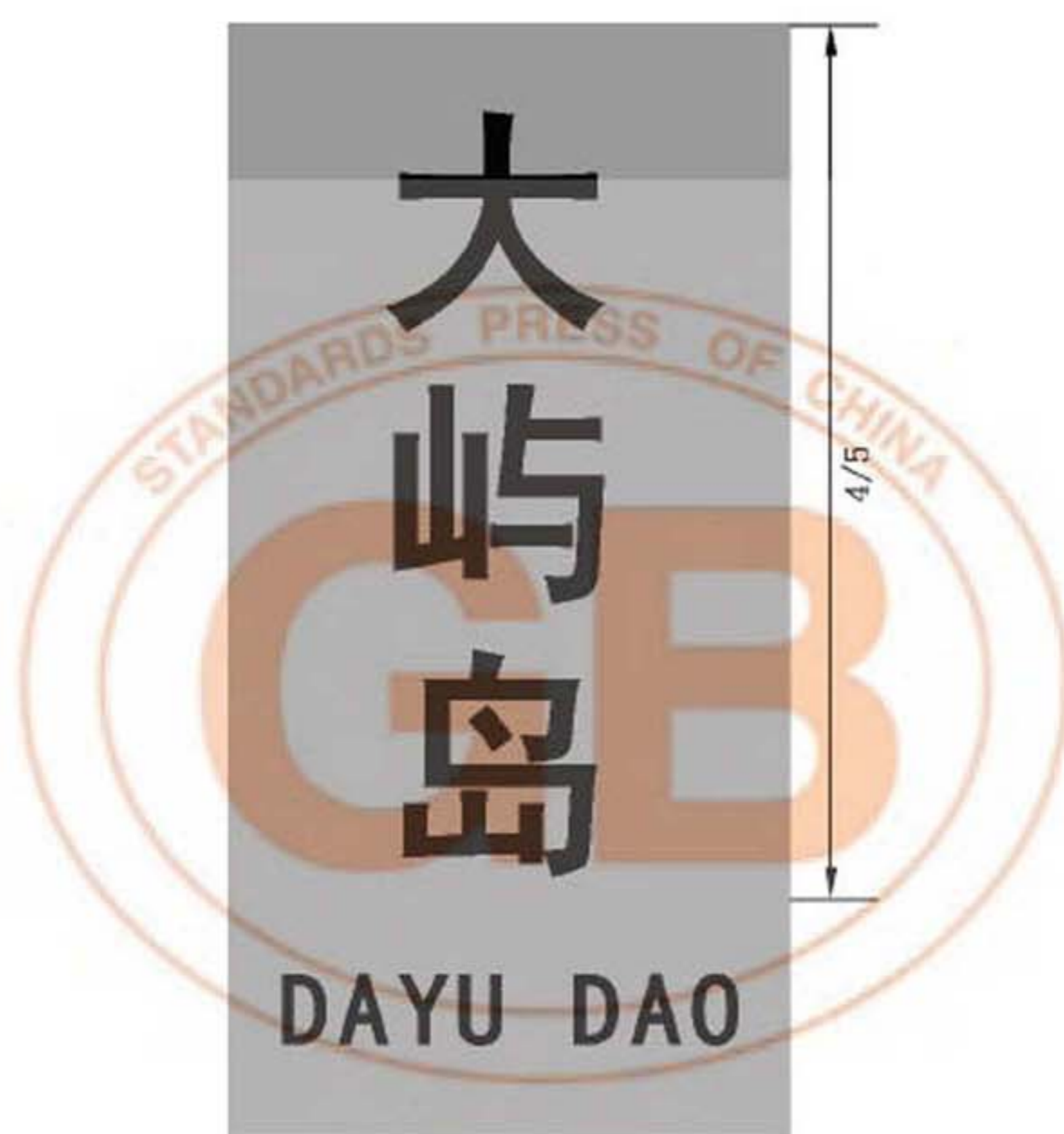
图 B.20 竖置的碑碣式地名标志版面示例