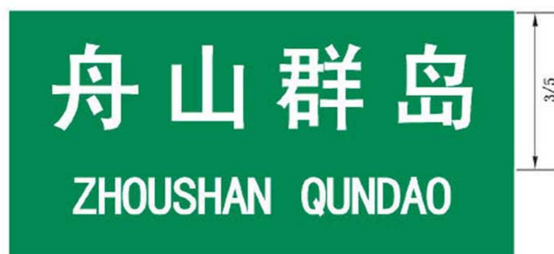
图 B.1 海域地名标志版面示例