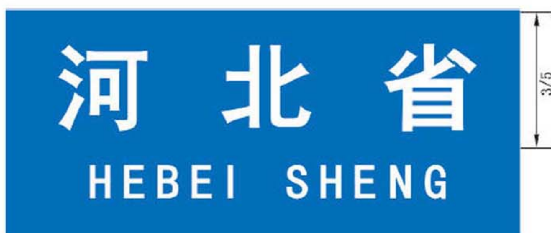
图 B.4 省级地名标志版面示例