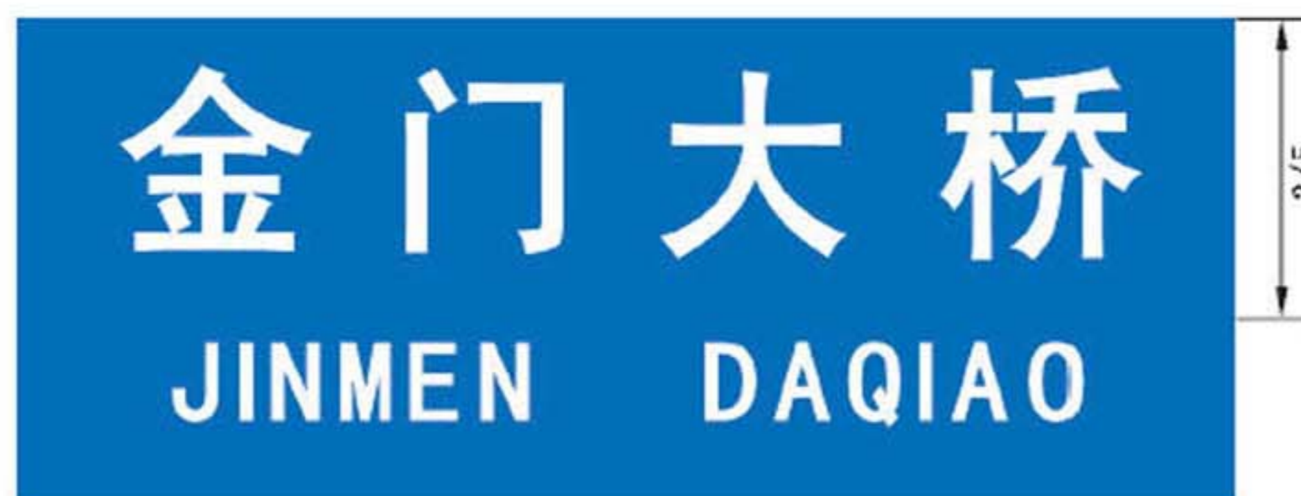
图 B.9 设施地名标志版面示例