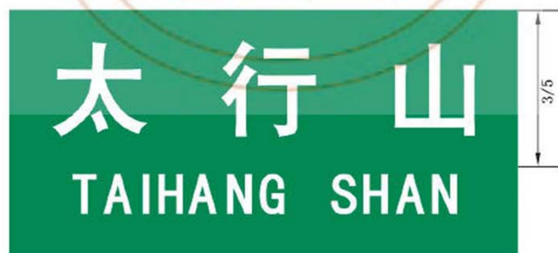
图 B.3 地形地名标志版面示例