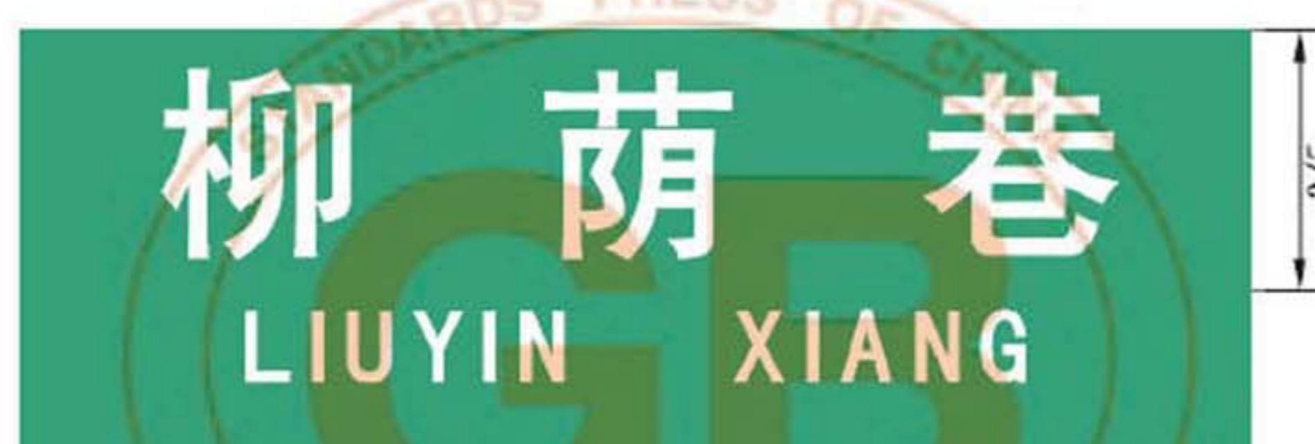
图 B.12 巷地名标志版面示例