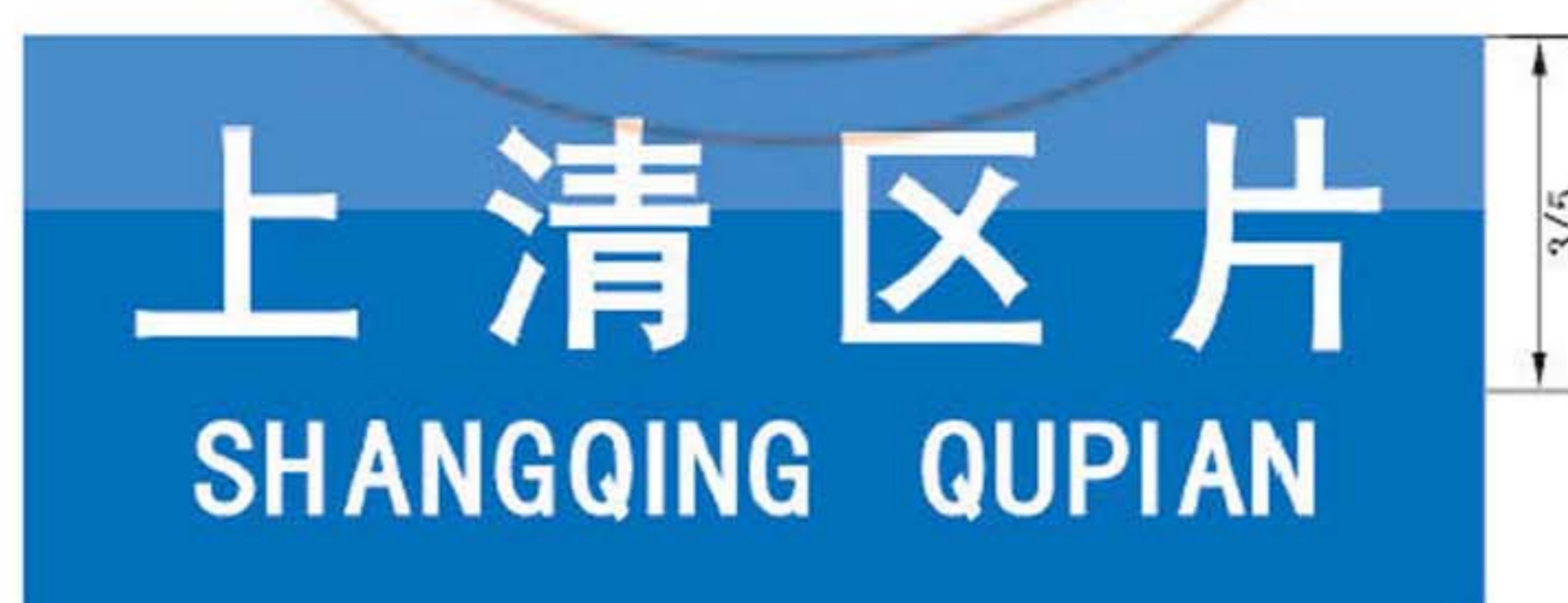
图 B.13 区片地名标志版面示例